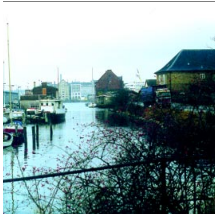
Trangraven mellem den Grønlandske handelsplads på venstre side og Christiansholm på højre side med fremtidigt cykeltracé og bro mod Nyhavn ved Kvæsthusbroen.

Der er spændende visuelle oplevelser på ruten.