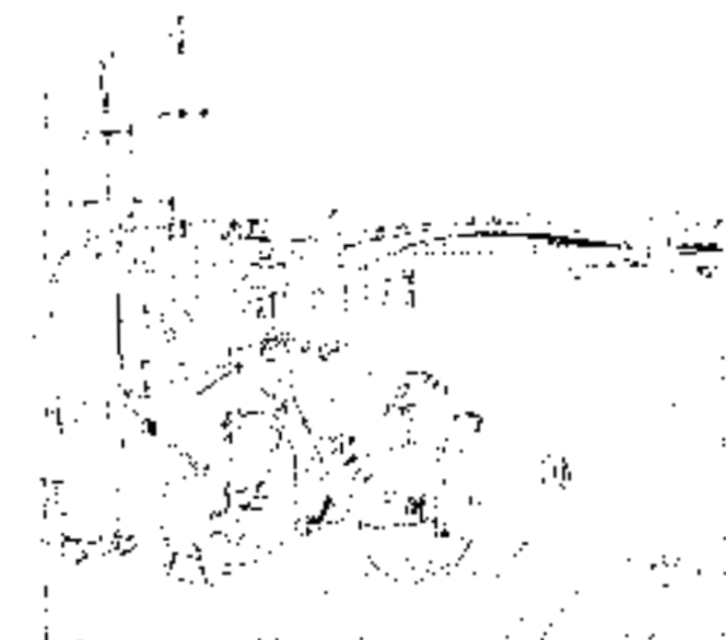
Udsigt mod Christianshavnsrutens fodgængerbro over havneløbet set fra den ny bro over Nyhavn.