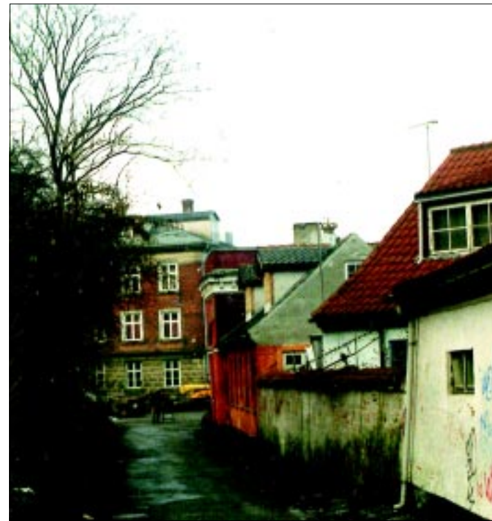
Fodgænger- og cykelsti gennem Sofie Hedevigs Bastion.

Ruten må karakteriseres som en både bymæssig og landskabelig smuk, åben rute. Krydsningen over havneløbet giver en varieret og spændende oplevelse med mange interessante udsigter over havnen. Over Arsenaløen og Sofie Hedevigs Bastion passerer dele af